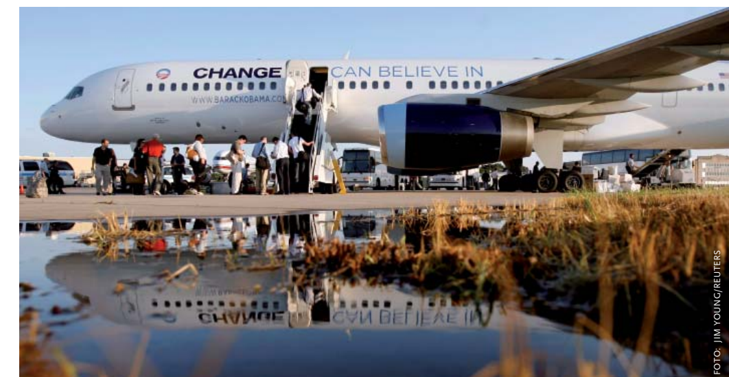
Het campagnevliegtuig van de democratische presidentskandidaat Barack Obama getuigt ervan dat hij het roer definitief wil omgooien – ook qua buitenlands beleid.

McCain is een uitgesproken voorstander van de oorlog in Irak en hij is van plan deze voorlopig te continueren. Tijdens zijn campagne voor de republikeinse nominatie liet hij zich meermaals ontvallen dat de VS desnoods honderd jaar in Irak zullen blijven als de situatie daarom vraagt. Ook inzake Iran volgt McCain meer het standpunt van Bush: Iran is een terroristische staat waarmee niet moet worden onderhandeld. Hij wil militair ingrijpen dan ook niet uitsluiten. Verder noemt McCain zichzelf een 'trotse pro-Israëliër' die vindt dat er geen vrede in het Midden-Oosten