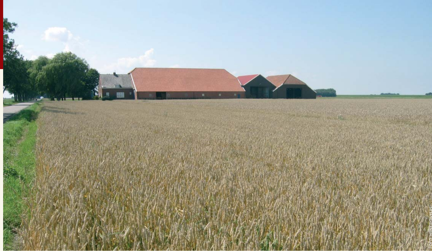
Een hoogproductieve Noord-Groningse akker vol tarwe.

Terwijl we ons in Nederland richten op vergroening van de landbouwsector, met agrarisch natuurbeheer en agrotourisme, constateert de denktank van het ministerie van LNV dat de hoogproductieve landbouwvelden in West-Europa hard nodig zijn voor de wereldvoedselproductie.