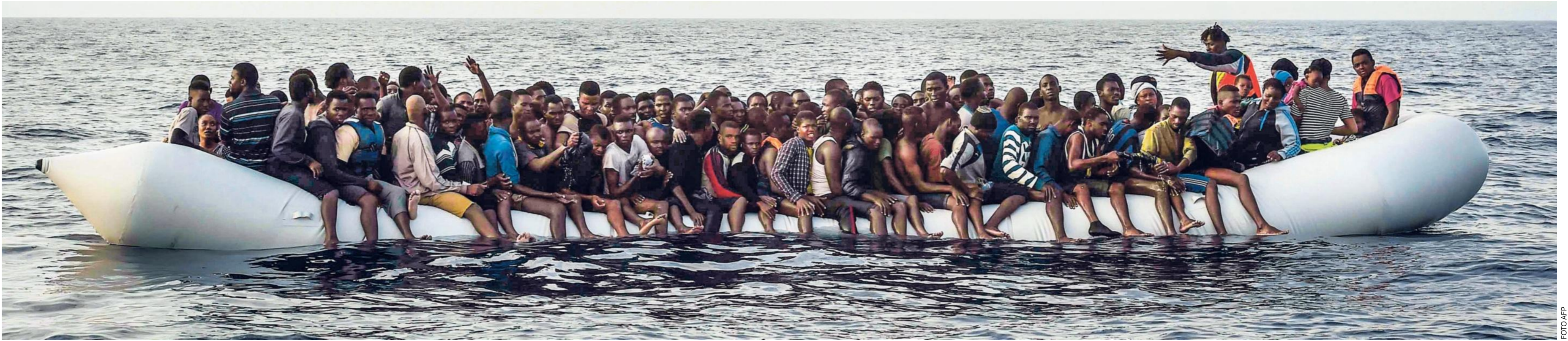
Migranten op 17 kilometer van de Libische kust wachten om te worden gered door de ngo Open Arms , 4 oktober 2016

Naast het morele bezwaar stellen ze dat het beleid ook nog eens niet effectief is. Hoe hoog je de hekken ook maakt, mensen komen toch wel. Fort Europa zorgt er alleen voor dat vluchtelingen op gammele bootjes de Middellandse Zee oversteken, soms met dodelijke afloop. De hartverscheurende foto van het aangespoelde kindje Aylan staat