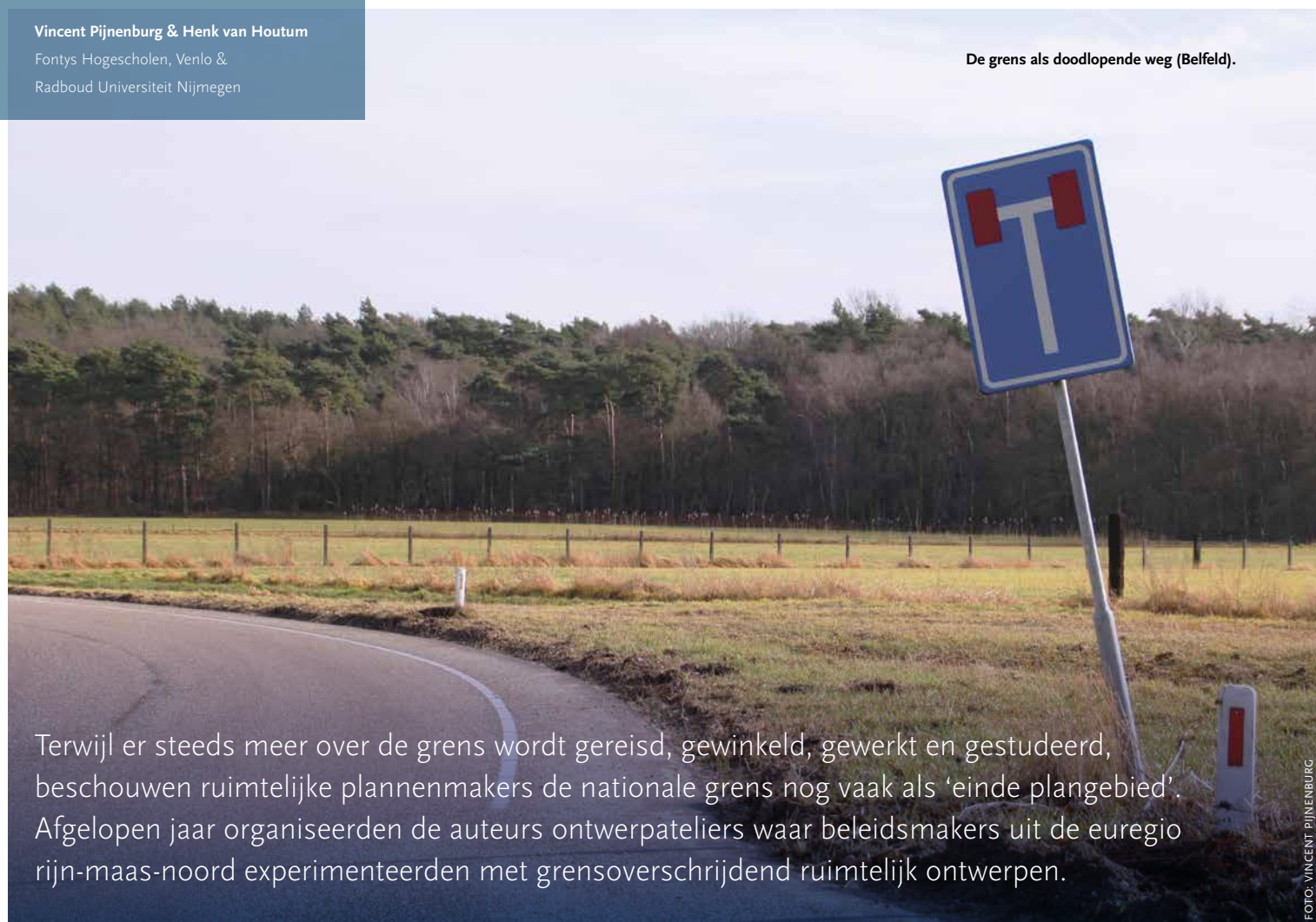
De grens als doodlopende weg (Belfeld).

Terwijl er steeds meer over de grens wordt gereisd, gewinkeld, gewerkt en gestudeerd, beschouwen ruimtelijke plannenmakers de nationale grens nog vaak als 'einde plangebied'. Afgelopen jaar organiseerden de auteurs ontwerpateliers waar beleidsmakers uit de euregio rijm-maas-noord experimenteerden met grensoverschrijdend ruimtelijk ontwerpen.