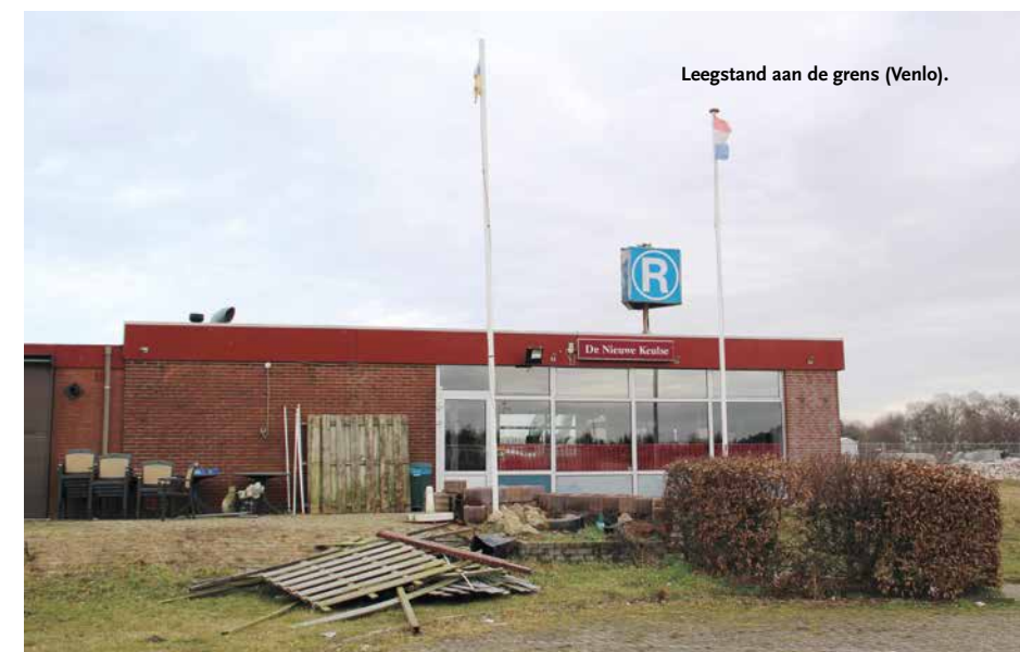
Leegstand aan de grens (Venlo).