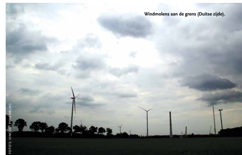
Windmolens aan de grens (Duitse zijde).